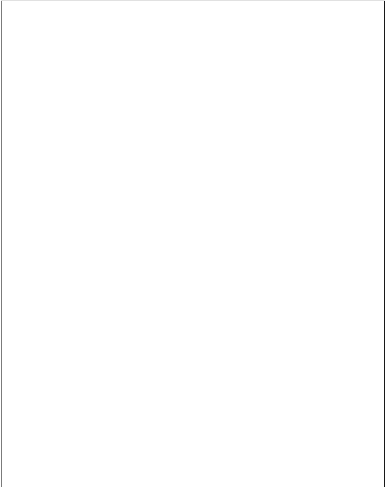
СХЕМА ГРАНИЦ ПРОЕКТИРОВАНИЯ