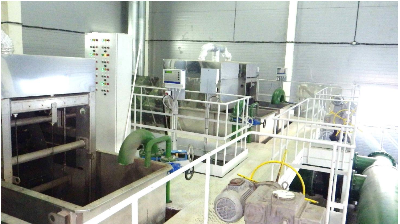
Рисунок 1. Помещение грубой механической очистки. Автоматические сорулавливающие решетки

Дренажная вода от песковых бункеров и цеха механического обезвоживания направляется в голову очистных сооружений.