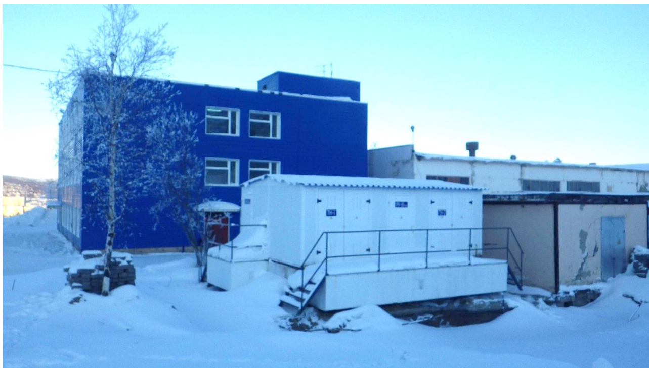
Рисунок 7. Административно-бытовой корпус

Здание выполнено из керамзитобетонных панелей с железобетонными перекрытиями.