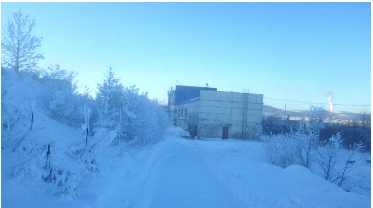
Рисунок 6. Здание цеха механического обезвоживания осадка

Реагенты для процесса обезвоживания осадка не используются.