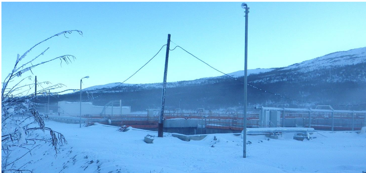
Рисунок 4. Аэротенки

Аэротенки (Рисунок 4) разработаны на основе технологии анаэробно-аноксидно-аэробной биологической очистки. Для удаления биогенных элементов (азота и фосфора) из сточных вод, аэротенки делятся на три зоны: 2 отсека анаэробной зоны, 2 отсека аноксидной зоны, 4 отсека аэробной. Перемешивание в первых четырех зонах принято мешалками, в аэробной зоне предусматривается мелкопузырчатая аэрация.