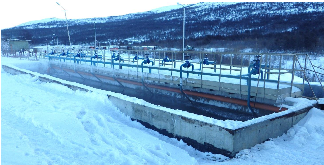
Рисунок 2. Песколовки

Удаление песка осуществляется гидроэлеваторами в песковые бункеры.