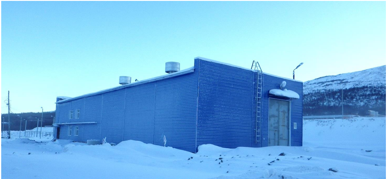
Рисунок 5. Здание УФО (бывшая хлораторная)