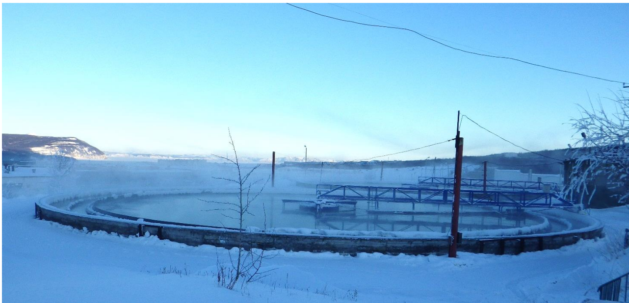
Рисунок 3. Первичные отстойники

В качестве первичных отстойников (Рисунок 3) на площадке эксплуатируются 3 радиальных отстойника диаметром 40 м.