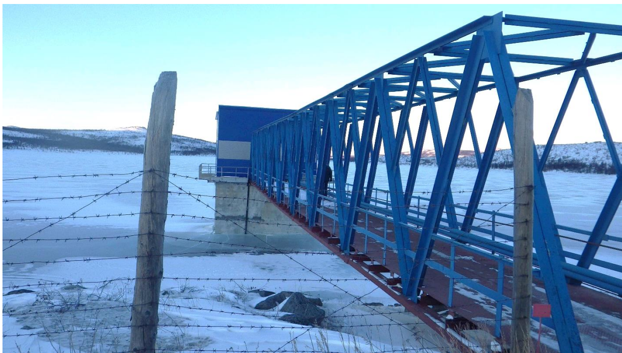
Рисунок 3. Водозаборная башня со служебным мостом

решетки грубой и мелкой очистки, задвижки. Для забора воды в башне предусмотрены отверстия на трех уровнях. На отметке 137,40 м в стене заложена труба диаметром 630 x 8 мм, на отметках 146,75 м и 151,00 м заложены трубы диаметром 426 x 8 мм. Надстройка башни управления размером в плане 7,0 x 8,0 м, высотой 6,5 м выполняется из бетонных блоков. В надстройке размещается однобалочный подвесной кран грузоподъемностью 3,2 т с ручным приводом. Башня соединена с плотиной служебным мостом пролетом 42,0 м (Рисунок 3).