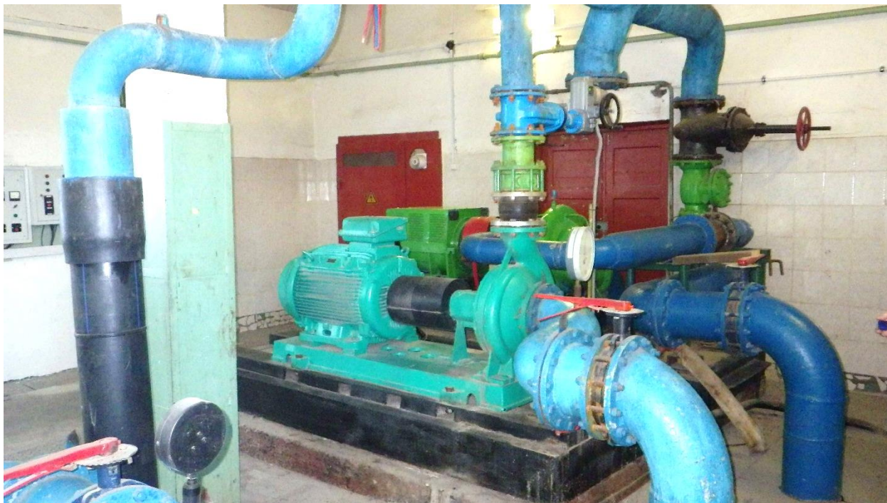
Рисунок 9. Машинный зал ВНС 2-го подъема на ул. Портовая, 4-а

Входящий напор воды в насосную станцию составляет 50 м, напор на выходе – 95 м. Характеристики установленного насосного оборудования представлены в таблице 1.6.2.