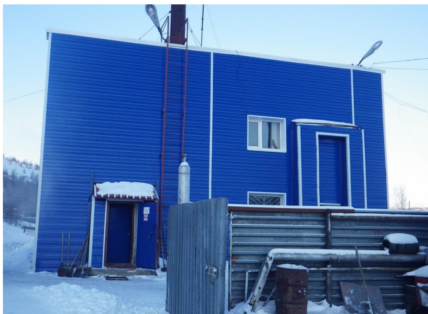
Рисунок 6. Станция по обеззараживанию питьевой воды ГПХН

На станции (ГПХН) используется технология производства раствора гипохлорита натрия методом электролиза поваренной соли при помощи трех установок ЭЛПК-45 (две рабочие, одна резервная) производительностью 45 кг активного хлора/сут каждая.