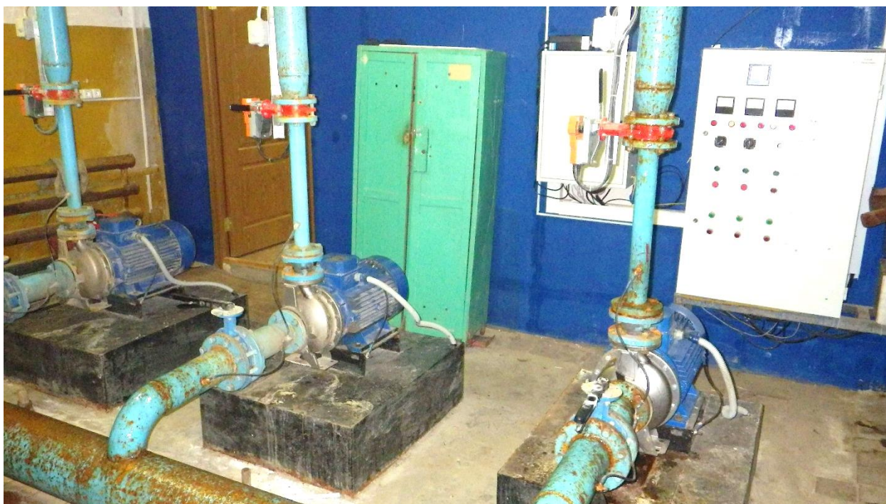
Рисунок 11. Машиный зал ВНС 2-го подъема «Мучные склады»

Входящий напор воды в насосную станцию составляет 25 м, напор на выходе – 80 м. Характеристики установленного насосного оборудования представлены в таблице 1.6.2.