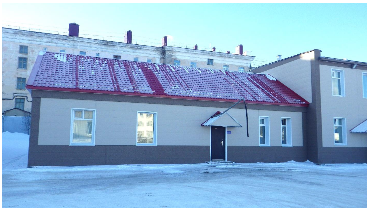
Рисунок 8. Здание насосной станции на ул. Портовая, 4-а

Источником хозяйственно-питьевого водоснабжения ВНС являются поверхностные воды водохранилища № 2, прошедшие процесс обеззараживания.