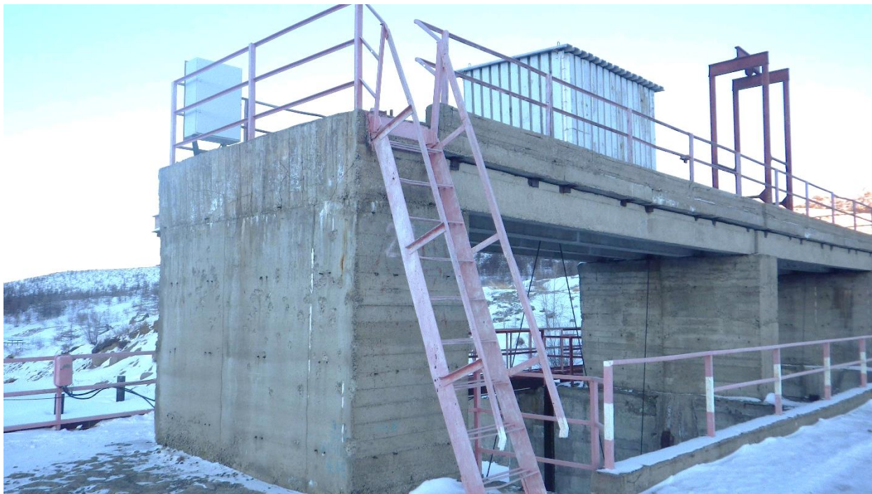
Рисунок 2. Паводковый водосброс

Для маневрирования затворами на служебном мостике установлены две лебедки грузоподъемностью по 3,5 т каждая. Через водослив выполнен железобетонный автодорожный мост шириной 5,0 м, длиной – 20,0 м.