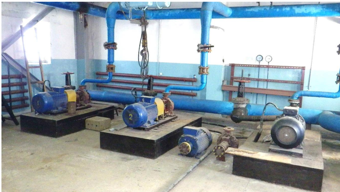
Рисунок 13. Машинный зал ВНС 2-го подъема в мкр. Пионерный

Входящий напор воды в насосную станцию составляет 30 м, напор на выходе – 95 м. Характеристики установленного насосного оборудования представлены в таблице 1.6.2.