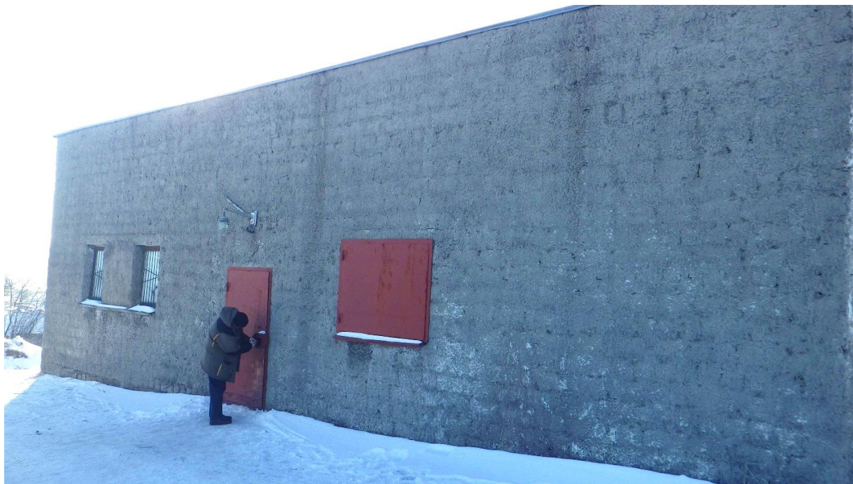
Рисунок 12. Здание насосной станции в мкр. Пионерный

ВНС 2-го подъема запроектирована для водоснабжения мкр. Пионерный (Рисунок 14). Проектная документация на ВНС отсутствует. Насосная станция введена в эксплуатацию в 1987 году. Производительность насосной станции – 3,48 тыс. м 3 /сут. Фактическая подача воды в часы максимального водоразбора – 51,3 м 3 /час, минимального – 33,1 м 3 /час.