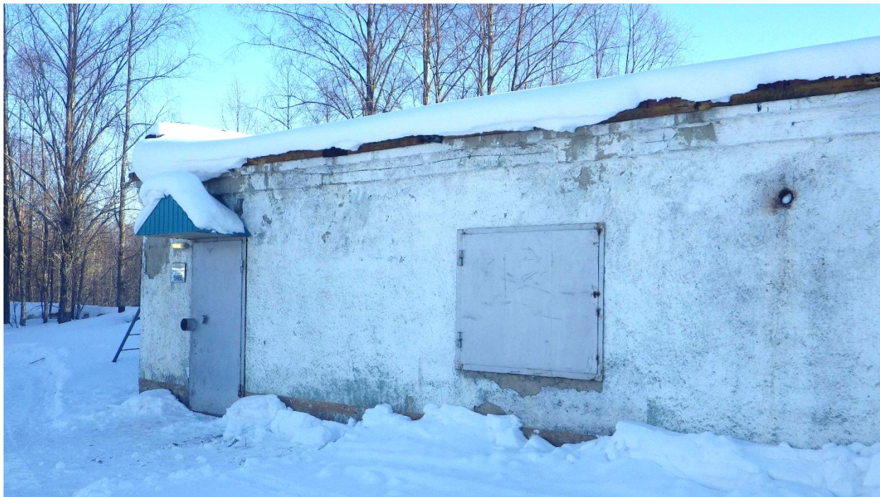
Рисунок 10. Здание насосной станции «Мучные склады»

ВНС 2-го подъема запроектирована для водоснабжения мкр. Солнечный (Рисунок 12). Проектная документация на ВНС отсутствует. Насосная станция введена в эксплуатацию в 1991 году. Производительность насосной станции – 1,2 тыс. м 3 /сут. Фактическая подача воды в часы максимального водоразбора – 40,7 м 3 /час, минимального – 29,8 м 3 /час.