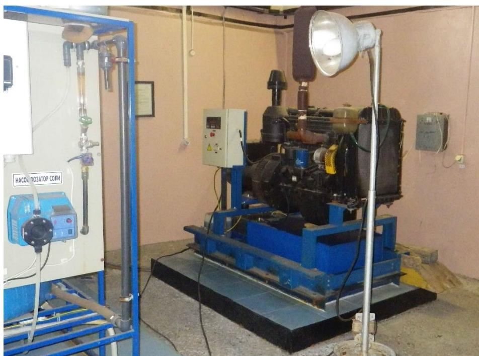
Рисунок 7. Дизель-генераторная установка

В качестве резервного источника электроснабжения установлен дизель-генератор мощностью 30 кВт (Рисунок 9)