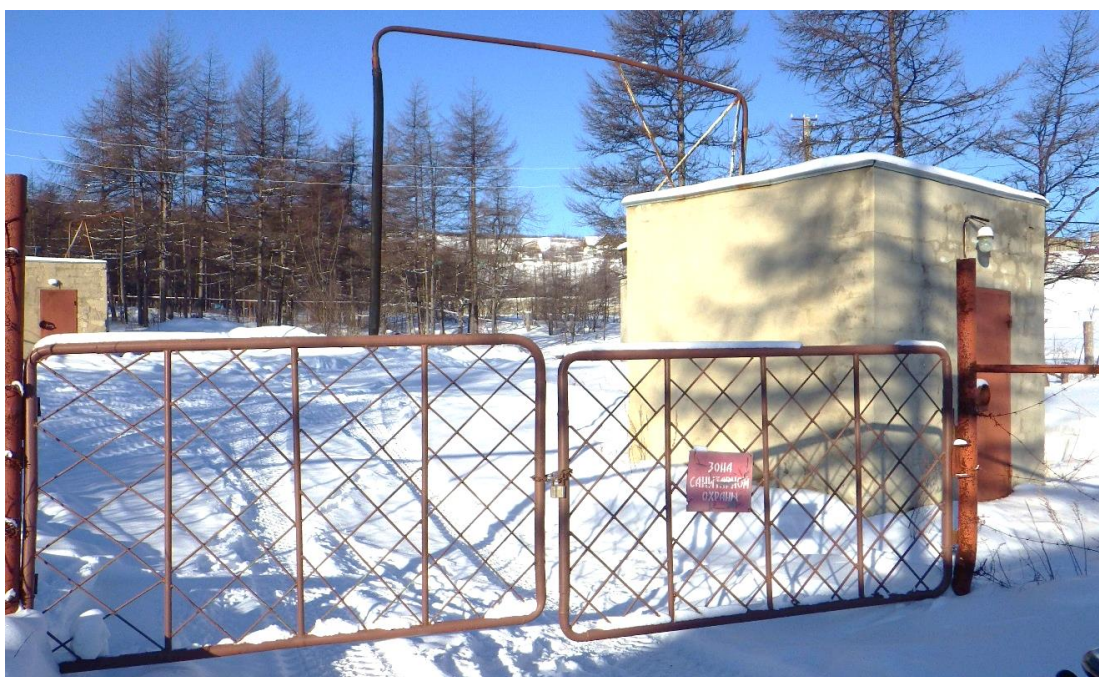
Рисунок 4. Павильоны артезианских скважин водозабора «Авиаторов»

Подземный водозабор «Авиаторов» служит источником водоснабжения мкр. Авиаторов и состоит из двух скважин, глубиной 67 и 80 м, расположенных на правом склоне долины р. Дукча на 13 км основной трассы Магадан-Сокол. Скважины находятся в отдельных блочных утепленных павильонах (Рисунок 4). Скважинами каптируется водоносная зона трещиноватости нижнемеловых интрузивов (ВЗТ К 2 ), перекрытая сверху безводными делювиально-элювиальными отложениями. Скважины эксплуатируются поочередно.