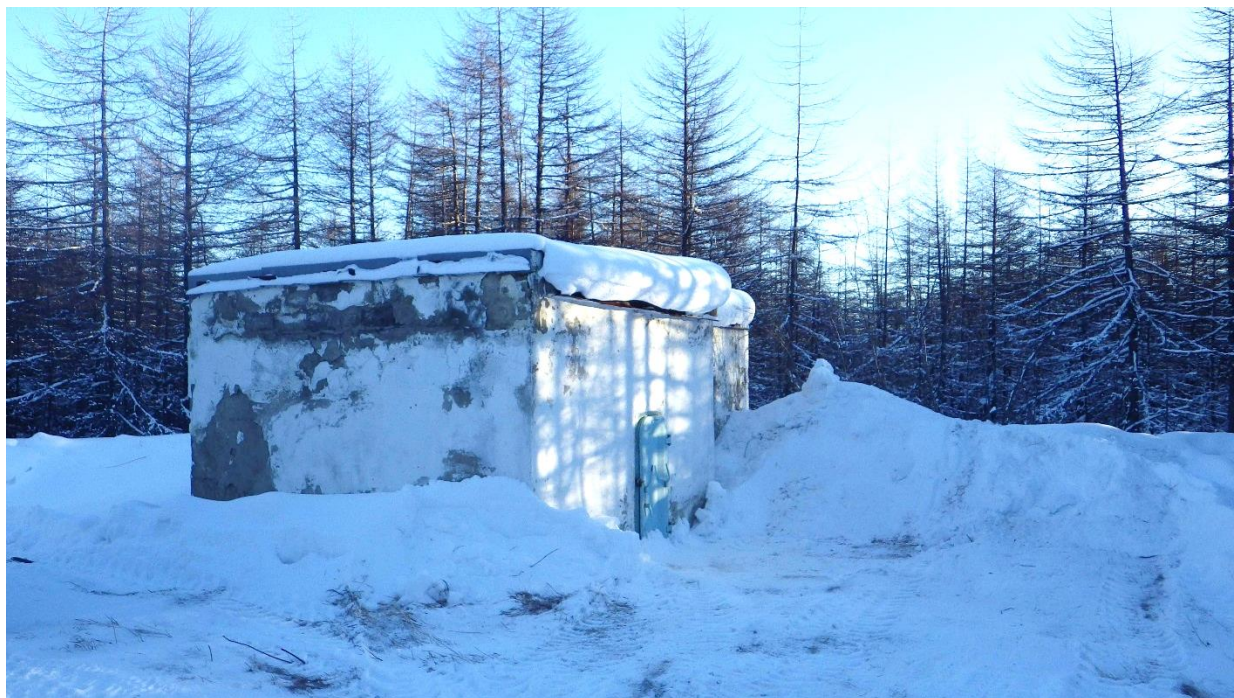
Рисунок 5. Павильоны скважин водозабора «Радист»

элювиальными отложениями. Скважины оборудованы насосами, эксплуатируются поочередно, вода поступает в сеть через водонапорную башню.