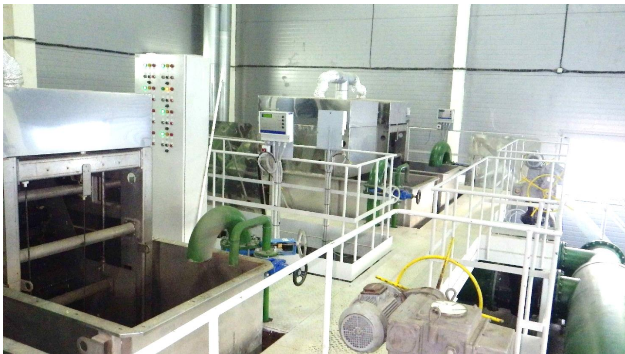
Рисунок 1. Помещение грубой механической очистки. Автоматические сорулавливающие решетки

Дренажная вода от песковых бункеров и цеха механического обезвоживания направляется в голову очистных сооружений.