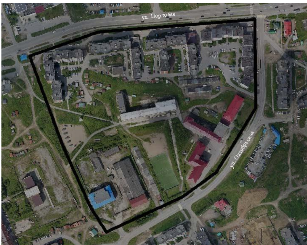
Схема № 1

Согласно сведениям Единого государственного реестра недвижимости, границы проекта межевания территории расположены в границах кадастрового квартала 49:09:031102. Границы проекта межевания территории представлены на схеме №1.