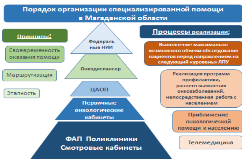
Таблица 1. Врачи-онкологи первичного онкологического кабинета

В медицинских организациях Магаданской области имеются флюорографы, маммографы, функционируют 9 смотровых кабинетов, 70% персонала подготовлены по онкологии. Проводятся профилактические осмотры на выявление онкологической патологии, у женщин берутся мазки из шейки матки на цитологическое исследование.