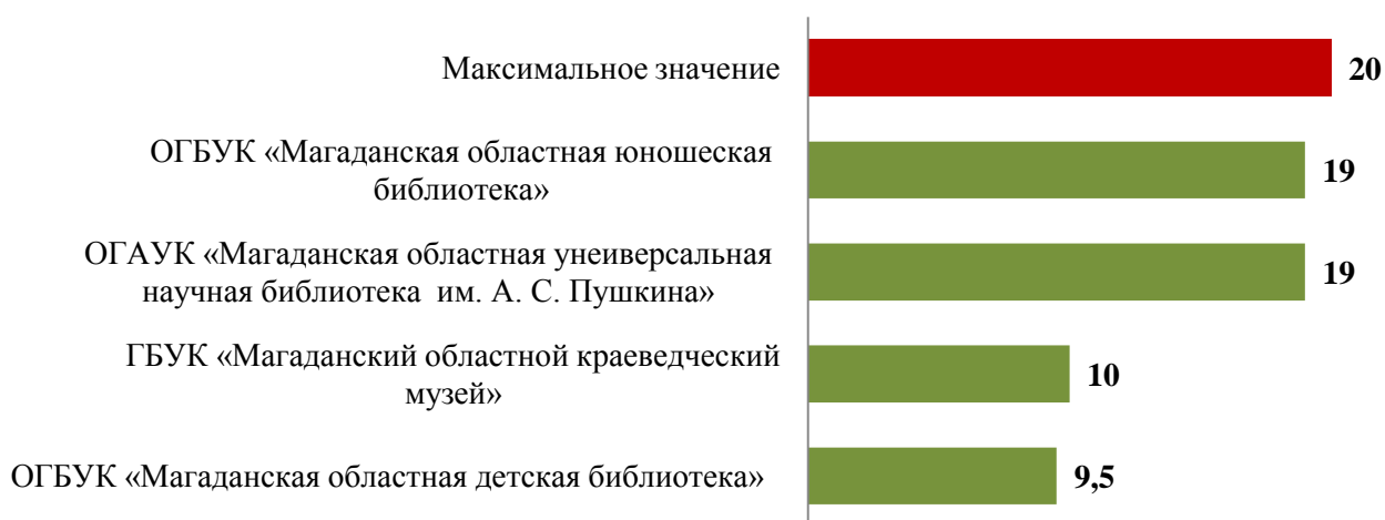
Рис. 2 Результаты независимой оценки уровня открытости и доступности информации на официальном сайте, в баллах

Из четырех оцениваемых учреждений, руководству Магаданской областной детской библиотеки и Магаданского областного краеведческого музея необходимо обратить внимание на заполняемость структуры официальных сайтов, так как даже небольшие недоработки в данном направлении ведут к существенному ухудшению общей оценки организации в рейтинге.