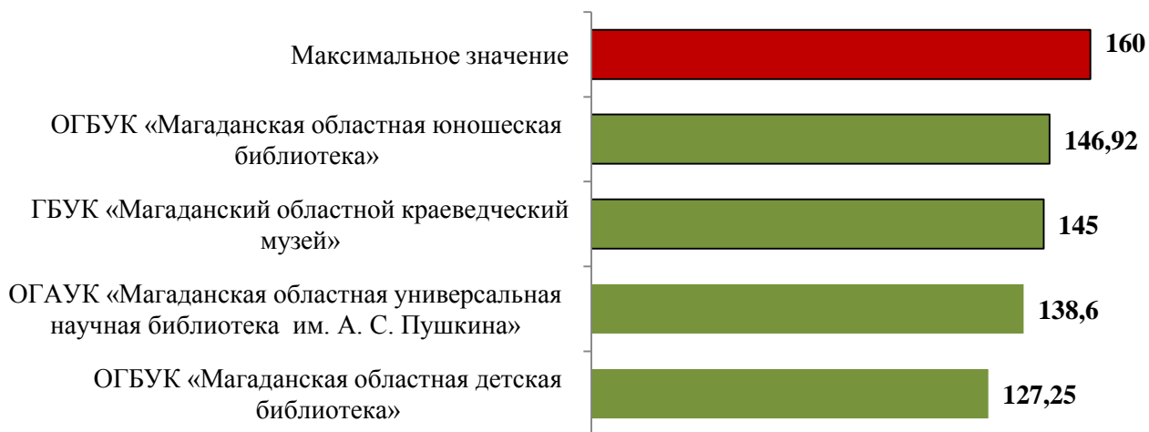
Рис. 3 Результаты независимой оценки качества предоставляемых услуг учреждениями культуры Магаданской области (общие баллы)

По итогам независимой оценки качества условий оказания услуг можно акцентировать внимание на то, что в худшем положении оказались те организации, которые своевременно не отреагировали на требования, предъявляемые к официальным сайтам учреждений культуры.