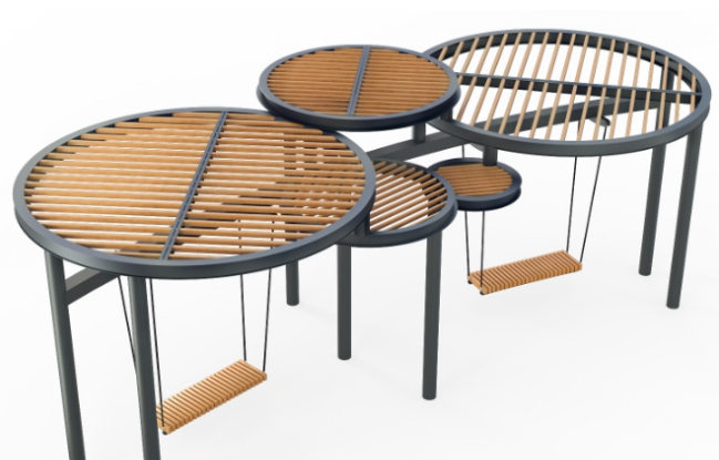
Качели «Оазис» Тип 2