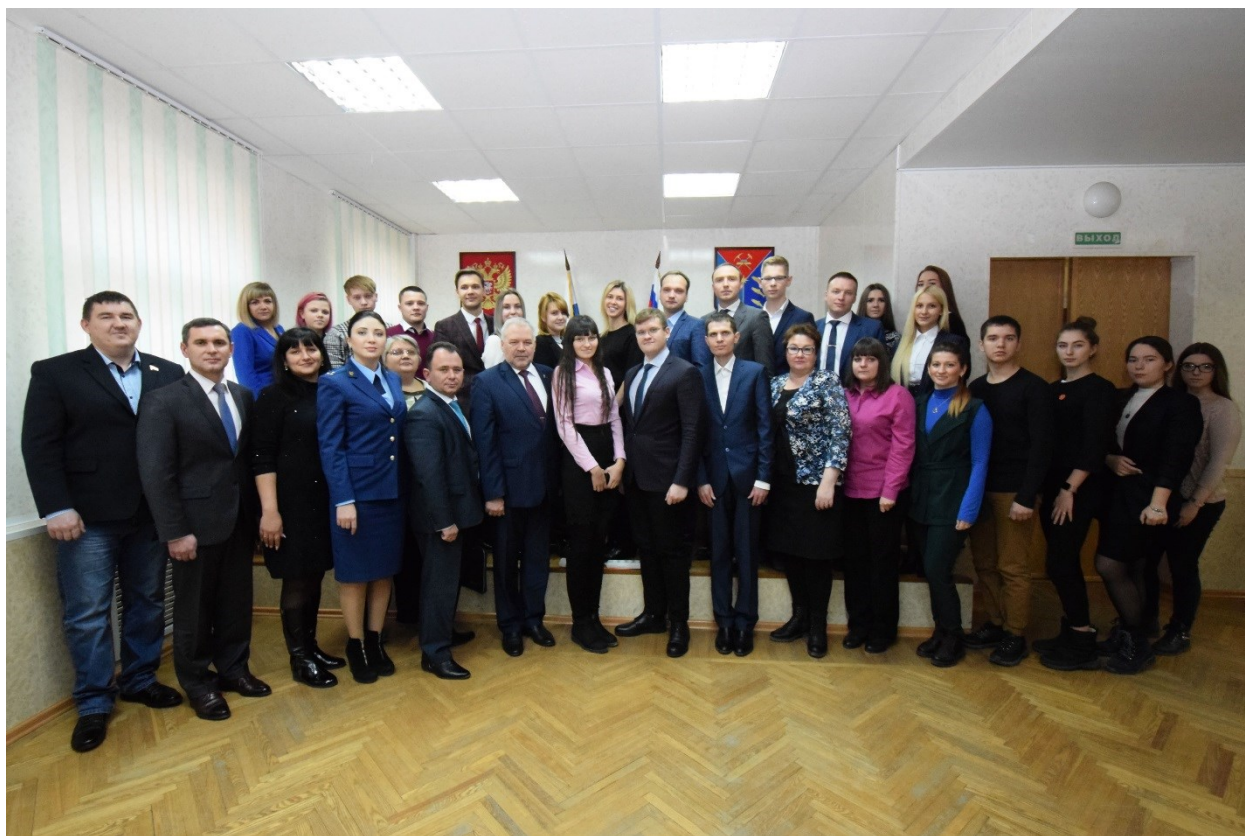
Участники круглого стола на тему: «Безопасность информационного пространства для несовершеннолетних в Магаданской области». Актовый зал Управления Министерства юстиции Российской Федерации по Магаданской области и Чукотскому автономному округу 12 ноября 2019 года

Брошюра подготовлена аппаратом Магаданской областной Думы по материалам выступлений экспертов, участников круглого стола.